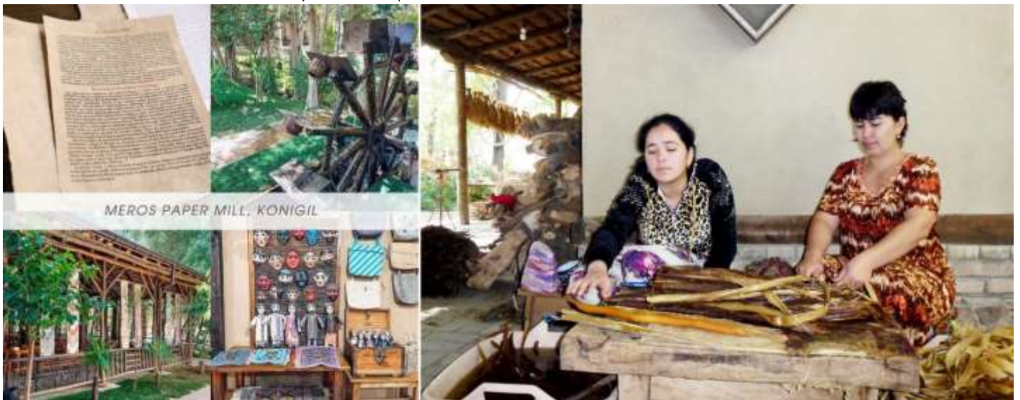
MEROS PAPER MILL, KONIGIL