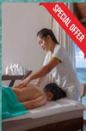
SPA 30 mins