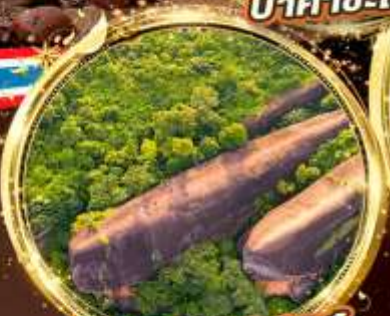
หินสามวาฬ