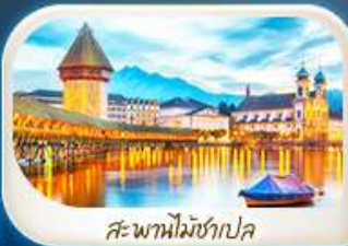
สะพานไมซ์ชาเปล