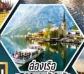
รถไฟ ทะเลสาบอัลสติก