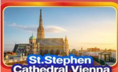
St. Stephen Cathedral Vienna