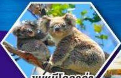
ชมหมีโคอาล่า ณ สวนสัตว์ซิดนีย์