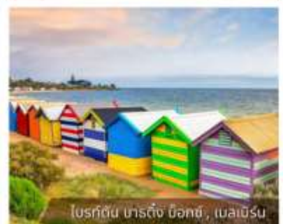
โบสถ์ต้น นาร์ติง บิชอป, เมลเบิร์น