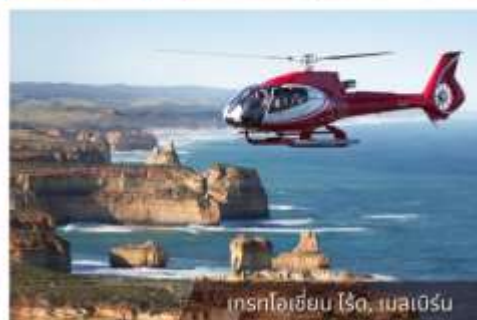
เฮลิคอปเตอร์ ไรต์, เมลเบิร์น