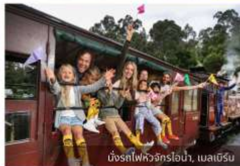
นั่งรถไฟหัวจักรไอน้ำ, เมลเบิร์น