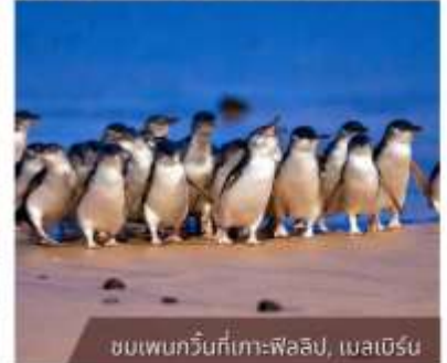
ชมเพนกวินที่เกาะฟิลลิป, เมลเบิร์น