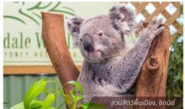
สวนสัตว์ฟีนเมือง, ซิดนีย์