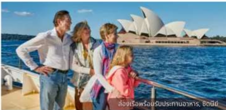
ล่องเรือพร้อมรับประทานอาหาร, ซิดนีย์