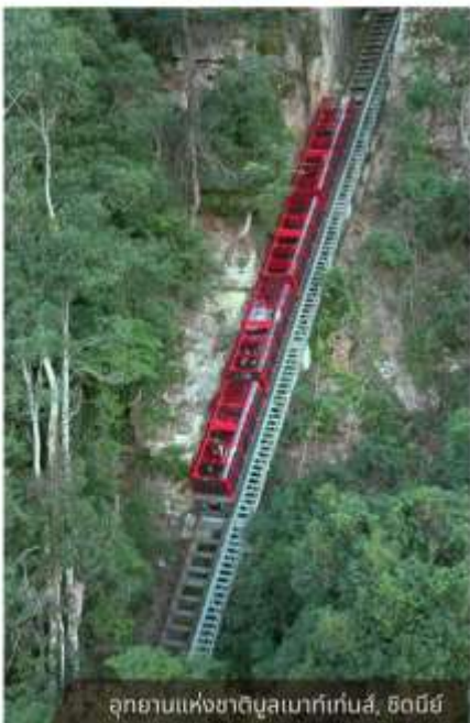
อุทยานแห่งชาติบลูเมาท์เท็นส์, ซิดนีย์