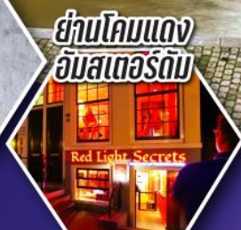
ย่านโคมแดง อัมสเตอร์ดัม

ตะลุยอัมสเตอร์ดัม ทั้งจตุรัสดามสแควร์ และย่านโคมแดง (Red Light)