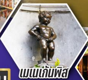
พเนถิ่นฟิส