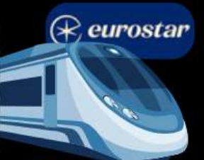
รถไฟความเร็วสูง จาก เบลเยียม สู่ ฝรั่งเศส