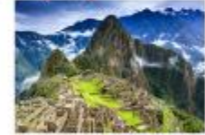
เมืองมาชู ปิกชู

** พักที่ Sonesta Cusco Hotel 4* หรือเทียบเท่า **