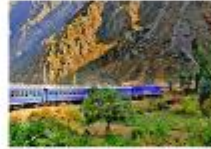
รถไฟขบวนพิเศษ Vistadome