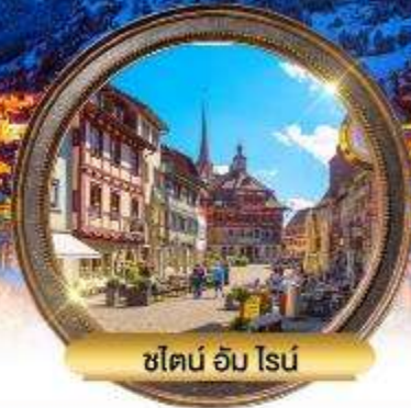
ชิลอน อัม โรน