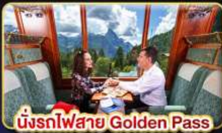
นั่งรถไฟสาย Golden Pass