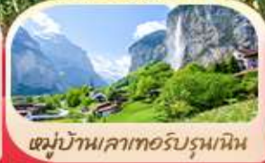
หมู่บ้านเลาเทอร์บรุนเนน