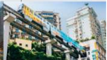
รถไฟฟ้าทะเลตึก

*ทางบริษัทฯ ขอสงวนสิทธิ์ในการสลับโปรแกรมทัวร์ตามความเหมาะสมขึ้นอยู่กับสถานการณ์ปัจจุบัน โดยคำนึงถึงผลประโยชน์ของลูกค้าเป็นสำคัญ