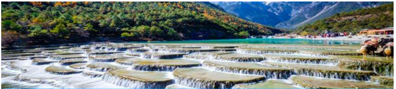
หุบเขาพระจันทร์สีน้ำเงิน Blue Moon Valley

หมายเหตุ กรณีที่กระเซ็นใหญ่ขึ้นภูเขาหิมะมังกรหยกปิดให้บริการ ด้วยเหตุที่สภาพอากาศไม่เอื้ออำนวย หรือเป็นการปิดเพื่อตรวจสอบสภาพและซ่อมแซมประจำปี ทางทัวร์ขอสงวนสิทธิ์ที่จะจัดโปรแกรมขึ้นกระเซ็น ที่จุดชมวิวกุเขาหิมะมังกรหยก ณ สถานีกระเซ็นหุยนซานผิง แทน