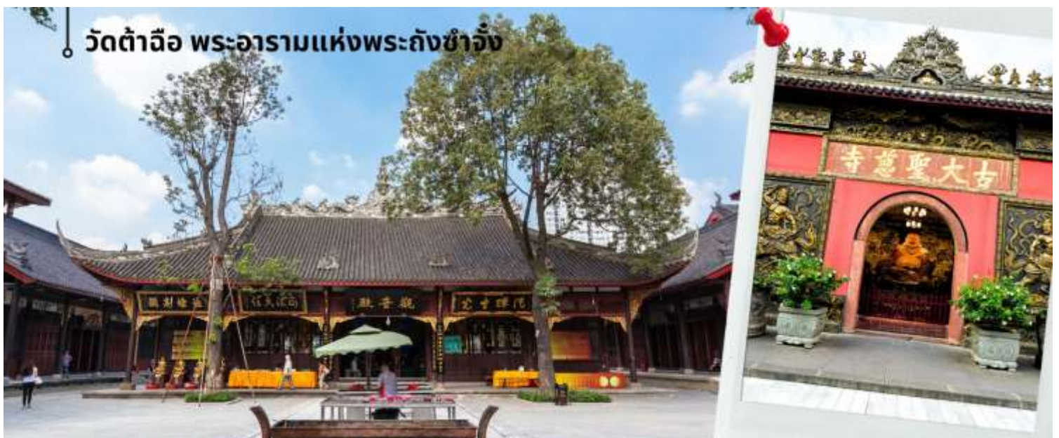
วัดต้าฉือ พระอารามแห่งพระถังซำจั๋ง

นำท่านชม วัดต้าฉือ (พระอารามแห่งพระถังซำจั๋ง) ในกลางนครเฉิงตู พระถังซำจั๋ง ได้รับการสรรเสริญว่าเป็นผู้มีความเพียร และมีชื่อเสียงมายาวนานกว่า 1,400 ปี และยังได้รับการยกย่องว่าเป็น พระไตรปิฎกแห่งราชวงศ์ถัง พุทธประวัติของพระถังซำจั๋งถูกจารึกในสถานที่ต่างๆ มากมาย รวมไปถึงได้ถูกกล่าวถึงในจดหมายเหตุหลายเล่ม ตามเส้นทางการเดินทางแห่งความเพียรของท่าน รวมทั้งมีพระอัฐิของท่าน ประดิษฐานอยู่ในพระอารามของนครนานจิง และที่ทะเลสาบสุรียันจันทราเป็นเกาะได้วันอีกด้วย