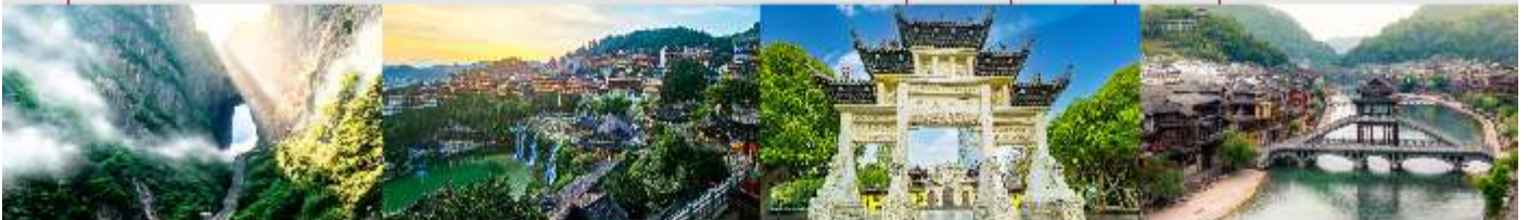
ประตูสวรรค์