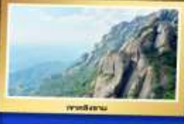
เขาเทียนซาน