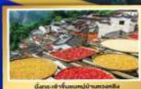
นี่คือบ้านชนบทหมู่บ้านหวงหลิง