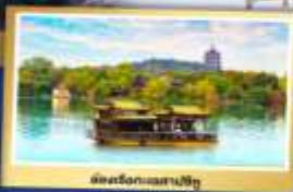
นี่คือล่องแก่งสาปิง