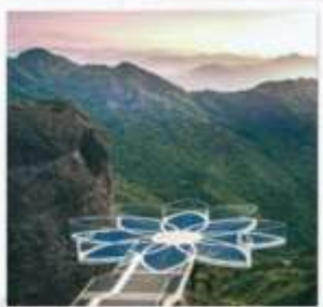
สะพานบัวสวรรค์