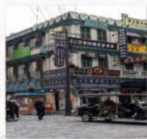
ถนนคนเดินกวางโจว