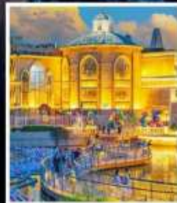
ห้าง SOLANA CENTER