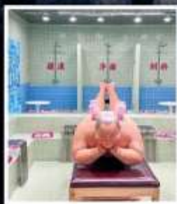
คาเฟ่ย้อนยุคเหอผิง