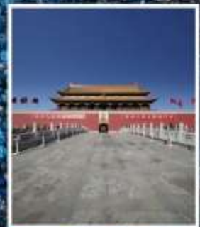
จัตุรัส เทียนอันเหมิน