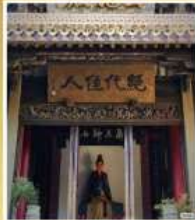
บ้านเกิด 4 ยอด หญิงงามไซซี