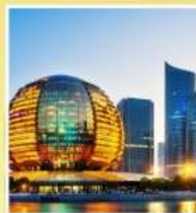
HANGZHOU CITY BALCONY