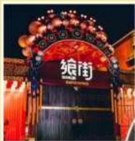
ถนนคนเดินกู่เยว่ GUYUE STREET