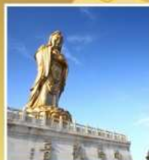
องค์เจ้าแม่กวนอิมหนานไห่