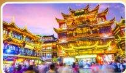
ตลาดร้อยปีเจิ้งหวงเหมียว