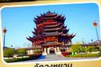
วัดหลงหยวน