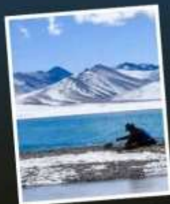
ทะเลสาบน่านมู่ซัว