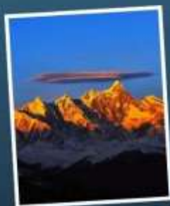
ยอดเขาหนานเจียปาหว่า