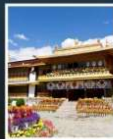
ท่าหนักนอร์บุหลิงฆา