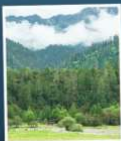
ทะเลป่าหลู่กลาง