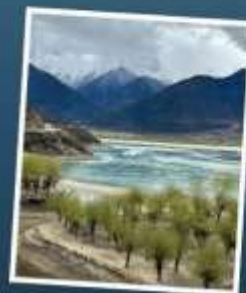
อุทยานเขาเป็นยี่