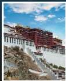
พระราชวังโปตาลา