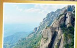
เทามิ่งซาน