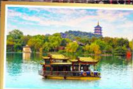
ล่องเรือทะเลสาบซีหู