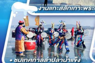
ชมเทศกาลสาปน้ำแข็ง