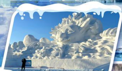
งานแกะสลักเทวพระอาทิตย์