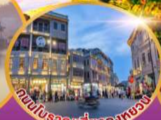
ถนนโบราณที่สวยงาม