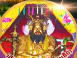
เจียงมูซิว (ศาลเจ้าพ่อเสือ)

เมนูพิเศษ!! อาหารแต้จิ๋ว 18 อย่าง ห้ามพลาด! ดินดำรับชวงเกา สุกี้ซีฟู้ด