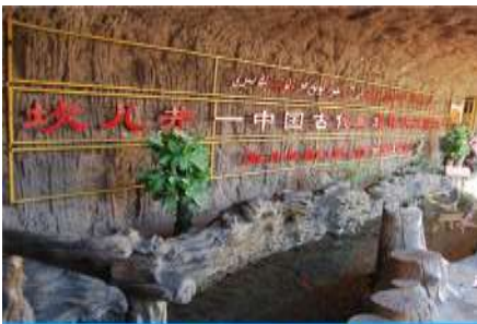
ระบบชลประทานถูหลู่ฟาน

พักที่ HAMPTON BY HILTON HOTEL โรงแรมระดับ 4 ดาวหรือเทียบเท่าในเมืองถูหลู่ฟาน