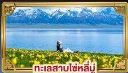
ทะเลสาบโซหลี่มู่