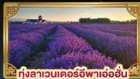
ทุ่งลาเวนเดอร์อูฟาอ้อฮัน