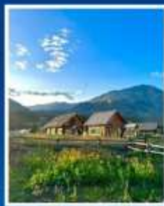
หมู่บ้านเหม่อลู่ซุน