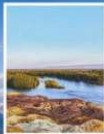
ธารน้ำ 5 สี