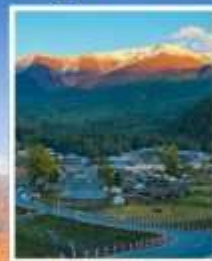
หมู่บ้านไปฮาปา