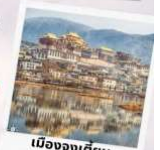
เมืองจงเตียน แซงกรี่ล่า