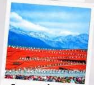
โชว์ จางอีโหมว