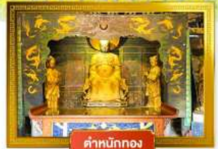
ตำหนักทอง