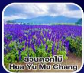
สวนดอกไม้ Hua Yu Mu Chang