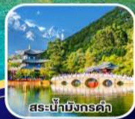
สระน้ำมังกรดำ