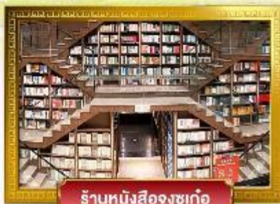
ร้านหนังสือจงชุก่อ