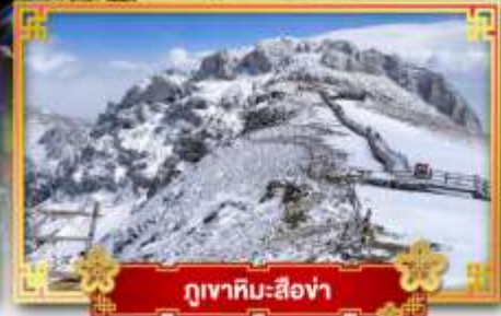
ภูเขาหิมะสี้อ่า