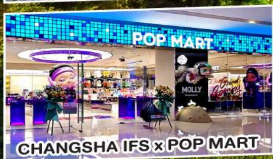
CHANGSHA IFS x POP MART