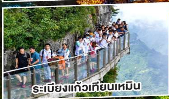
ระเบียงแก้วเทียนเหมิน