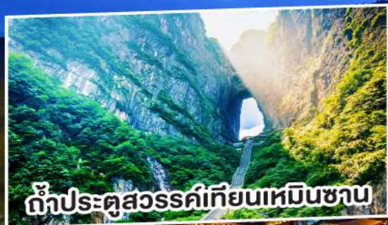
ถ้าประตูสวรรค์เทียนเหมินชาน

สัมผัสมนต์ขลังฟูหรงเจิน พิษิตรีเบียงแก้วเทียนเหมิน