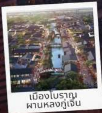
เมืองโบราณ ผานหลงกุเจิน