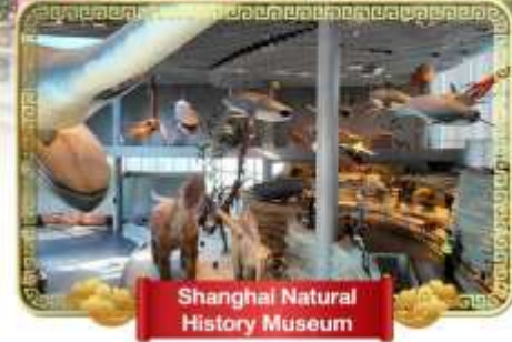
Shanghai Natural History Museum