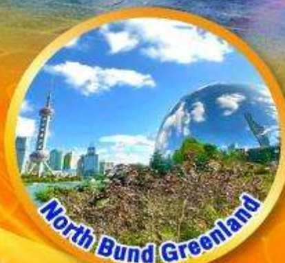
North Bund Greenland