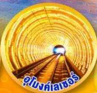
อุโมงค์ลาเซอร์