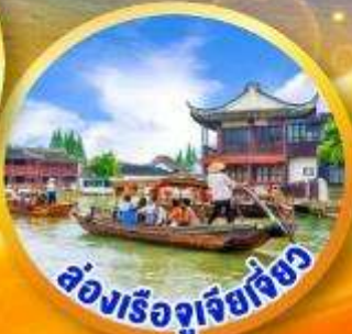
ล่องเรือจูเจียเจียว