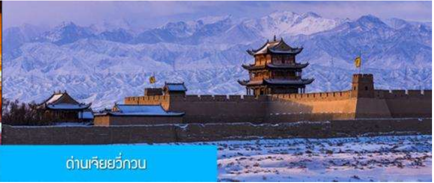
ด่านเจียชี่กวน

วันที่สาม เมืองจางเยี่ย – วัดพระใหญ่เมืองจางเยี่ย –เดินทางสู่เมืองเจียชี่กวน-ด่านเจียชี่กวน