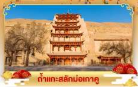
กำแพงสลักม่อเถาตู

เดินทางโดย : สายการบินโซนาอิสิเทิร์นแอร์ไลน์ & เชียงไฮแอร์ไลน์