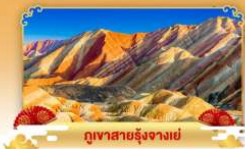
ภูเขาสายรุ้งจางเย่