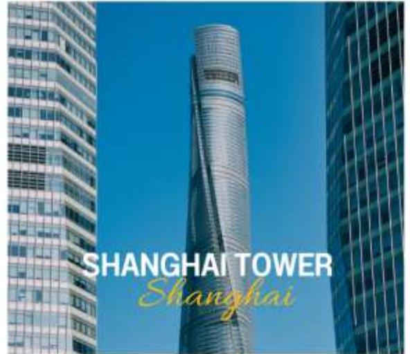
SHANGHAI TOWER Shanghai

เป็นหนึ่งในตึกระฟ้าที่ยิ่งใหญ่ที่สุดในโลกและเป็นสัญลักษณ์ของการพัฒนาและความเจริญก้าวหน้าของเมืองเซี่ยงไฮ้ในช่วงทศวรรษที่ผ่านมาตึกนี้ไม่เพียงแต่มีความสูงที่น่าประทับใจแต่ยังเป็นสัญลักษณ์ของความทันสมัยและนวัตกรรมในด้านสถาปัตยกรรมและวิศวกรรมความสูงเซี่ยงไฮ้ทาวเวอร์มีความสูง 632 เมตรตึกที่สูงที่สุดในจีน และ อันดับที่ 2 ของโลก รองจาก เบิร์จคาลิฟา ที่ดูไบ ตึกนี้มี 128 ชั้น โดยมี 5 ชั้นใต้ดิน และการออกแบบที่มีการลดขนาดตัวอาคารจากฐานขึ้นไปยังชั้นบนทำให้รูปร่างของตึกดูเหมือน "ขดลวด" หรือ "เกลียว" ซึ่งช่วยให้ตึกมีความมั่นคงและสามารถต้านทานลมแรงได้ดี กระจกโปร่งแสงและเหล็กกล้าเพื่อให้ตึกมีลักษณะทันสมัยและสะท้อนความเป็นเมืองแห่งอนาคต