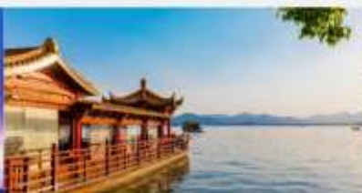
ล่องเรือชมทะเลสาบซีหู