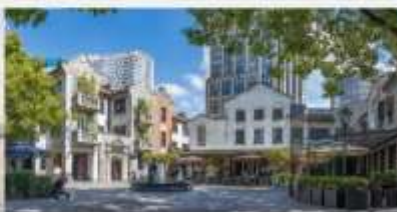
ย่านซินเกียนตี้