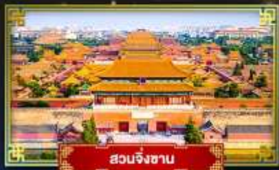
สวนจิ่งซาน