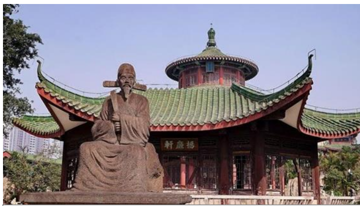
https://www.chinadiscovery.com/hainan/haikou/things-to-do.html Hairui Tomb © 海口市旅行社协会/ishar.ifeng

ค.ศ. 1587) เจ้าหน้าที่ผู้ซื่อสัตย์และไม่หวัหริต สุสานแห่งนี้สร้างขึ้นครั้งแรกในปี ค.ศ. 1589 ในสมัยราชวงศ์หมิง (ค.ศ. 1368-1644) โครงสร้างบางส่วนในสวนสุสานยังคงสภาพสมบูรณ์ ด้วยพื้นที่กว่า 4,000 ตารางเมตร การจัดวางสุสานได้รับการออกแบบตามระดับของตำแหน่งทางการในสมัยนั้น สถาปัตยกรรมและอาคารในสุสานไห่รุ่ย มีความเคร่งขรึมและดั้งเดิม มีซุ้มประตูหินสูงตระหง่านที่ประตูหน้า มีจารึกแนวอนว่า "ความชอบธรรมของกวางตุ้งตะวันออก (粤东正气)" ทางเดินยาวกว่า 100 เมตร ที่นำไปสู่สุสาน ปูด้วยหินแกรนิต มีการแกะสลักหิน เช่น รูปคนหิน แกะหิน ม้าหิน สิงโตหิน เต่าหินที่ยืนอยู่ทั้งสองข้าง ปัจจุบันสุสานแห่งนี้ได้รับการจัดอันดับให้เป็นมรดกทางวัฒนธรรมที่สำคัญของมณฑลไห่หล่า