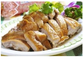
รูปเพื่อประกอบเท่านั้น

เป็ดเจี๋ยจี หรือที่เรียกกันว่า "ฟานย่า" มีกระหม่อมสีแดง ครีบเหลือง และขนสีดำและสีขาว เนื่องจากวิธีการให้อาหารที่ไม่เหมือนใครในพื้นที่เจี๋ยจีของไห่หล่า เป็ดจึงมีหน้าอกใหญ่ หนังบาง กระดูกอ่อน และเนื้อนุ่ม มีไขมันแต่ไม่มัน สามารถลองชิมได้ในร้านอาหารเกือบทุกแห่งในชานย่า