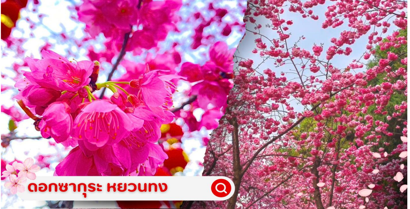
ดอกซากุระ หยวนทง

**ทั้งนี้ การบานของดอกไม้และชนิดของดอกไม้ขึ้นอยู่กับฤดูกาล,สภาพอากาศตามธรรมชาติ**