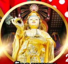
วัดดงหยวน