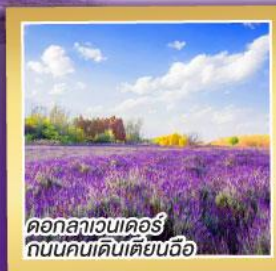
ดอกลาเวนเดอร์ ถนนคนเดินเตียนอิว