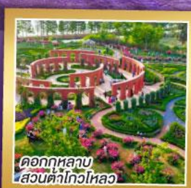
ดอกกุหลาบ สวนต้าโกวหลอ