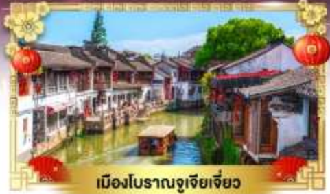
เมืองโบราณจูเจียเจียว