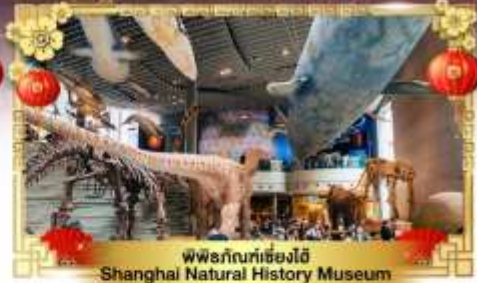
พิพิธภัณฑ์เซี่ยงไฮ้ Shanghai Natural History Museum

เดินทางโดย : สายการบินโซน่าอีสเทิร์นแอร์ไลน์