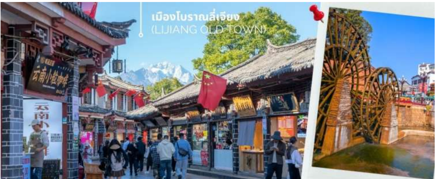
เมืองโบราณลี่เจียง (LIJIANG OLD TOWN)

นำท่านเดินทางชม เมืองโบราณลี่เจียง (LIJIANG OLD TOWN) หรือ เมืองโบราณต้าเอี้ยนเจิ้น เมืองเก่าแก่อายุกว่า 800 ปี ซึ่งภายในเมืองเก่านี้ยังคงมีสถาปัตยกรรมบ้านเรือนสไตล์จีนเก่าแก่ที่หาชมได้ยาก และได้รับการอนุรักษ์ไว้เป็นอย่างดี บางหลังเหมือนโรงเตี๊ยมโบราณที่เคยเห็นตามหนังจีนย้อนยุค บ้านเรือนส่วนใหญ่ถูกปรับเปลี่ยนให้กลายมาเป็น